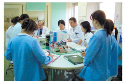
病棟カンファレンス

これから平成18年度の総仕上げに、又、来る年が希望に満ちた元気な明るい年になりますよう頑張りたいと思います。