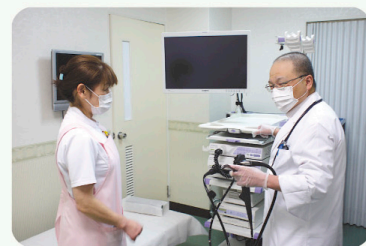
準備をする澤村医師と廣瀬看護師